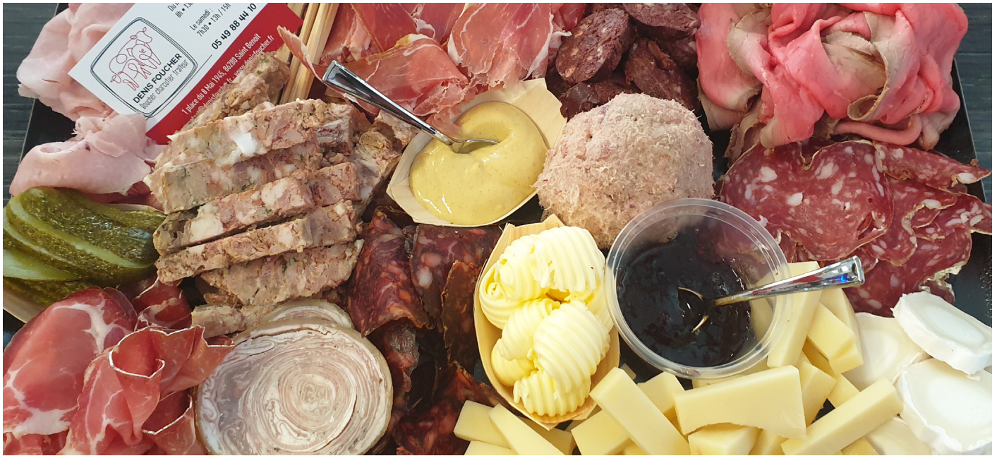
Planche mixte apéritive, charcuterie et fromage